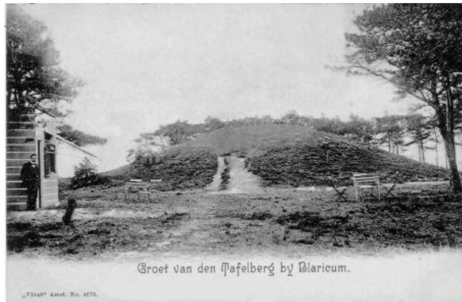
De Tafelberg. Hooftpunt van Noord Holland