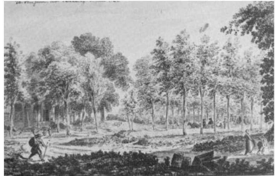
De brink in Bussum gezien vanuit de herberg 'De Oranjeboom'(1784)