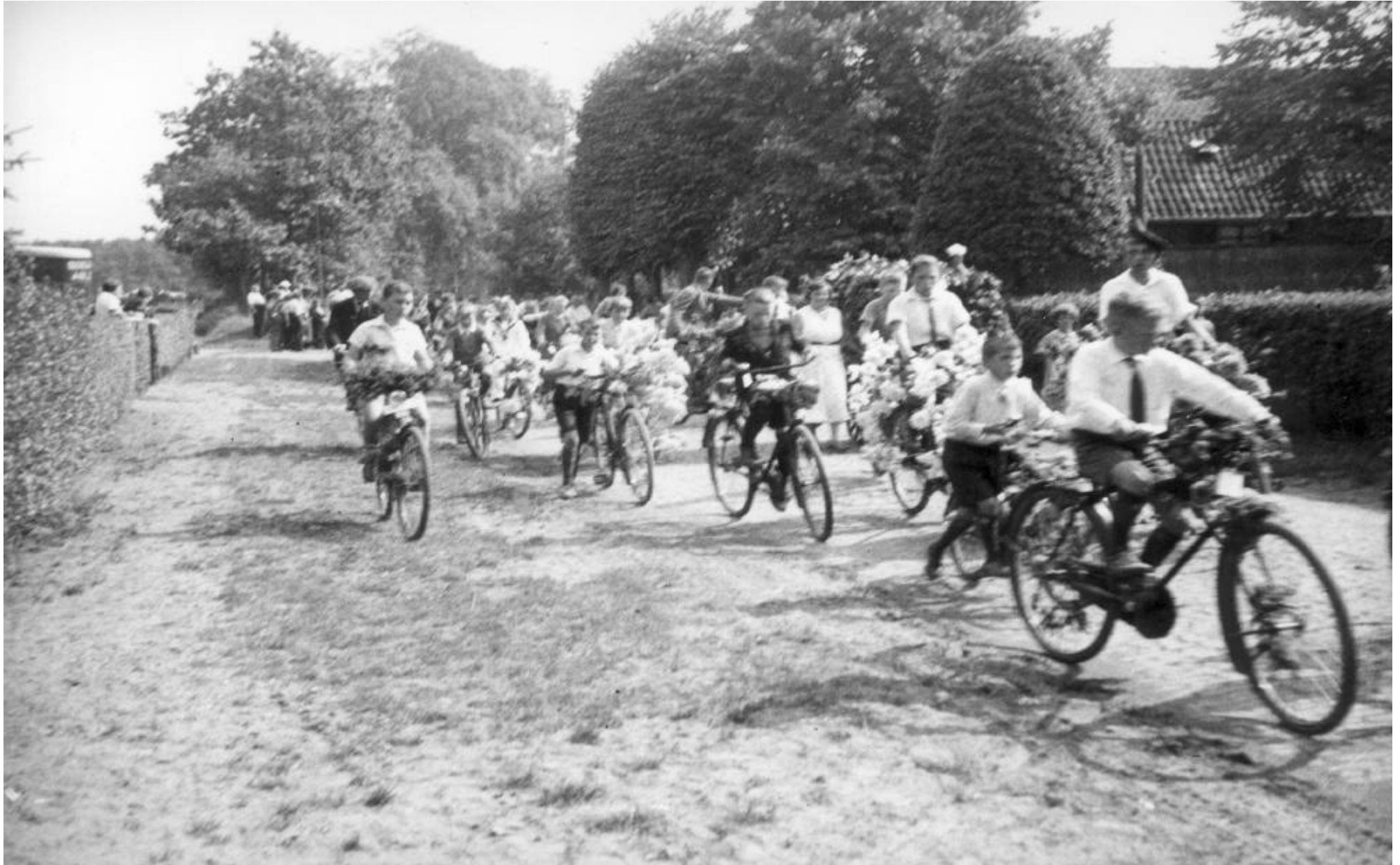
De jeugd viert kermis. Versierde fietsen op de Eemnesserweg (circa 1935)