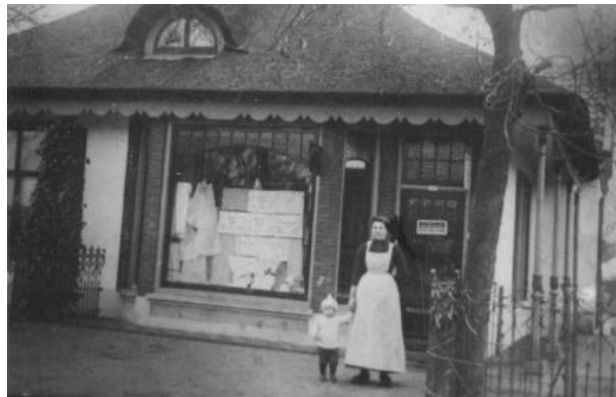
De lingeriewinkel van Vos aan de Dorpsstraat (thans Super de Boer)

Tenslotte werd door de vergadering een bestuursvoorstel goedgekeurd om een kleine wijziging van de statuten door te voeren. De wijziging houdt in,