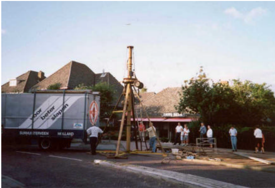
Het opbouwen van de zweefmolen van Verkuil in 1991

Toch zijn de kermissen van Laren en Blaricum zeer verschillend. Daar waar de kermis van Laren, die aanvankelijk op de Brink plaats vond, uitgroeide tot een grootse kermis met de nieuwste attracties, bleef de Blaricumse kermis een echt volksfeest. De kermis wordt in augustus gehouden en duurt slechts drie dagen. Het begin van de kermis is altijd op de eerste maandag na Maria Hemelvaart (15 augustus). Omdat de kermis nog steeds midden in het centrum gehouden wordt, moet de verkeersroute tussen Laren en Huizen worden omgeleid. In verband met de drukte op deze route mogen de exploitanten pas zondagavond opbouwen.