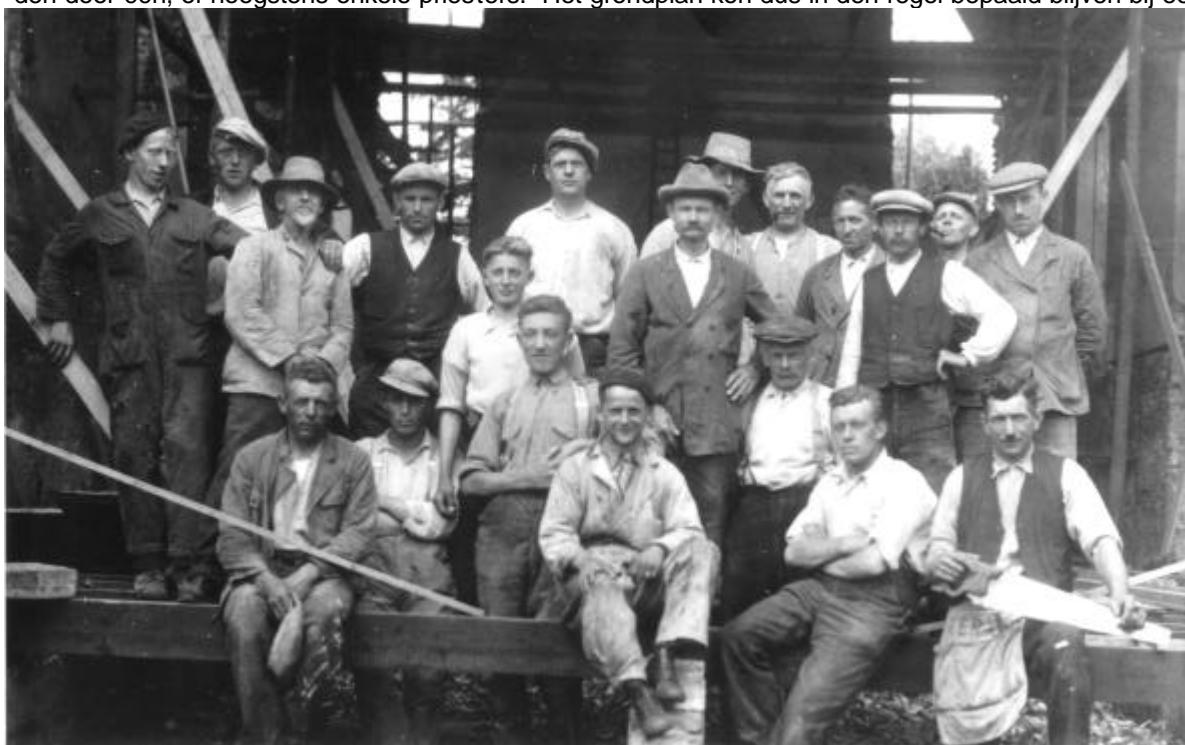
Werklieden tijdens de verbouwing van de kerk in 1934