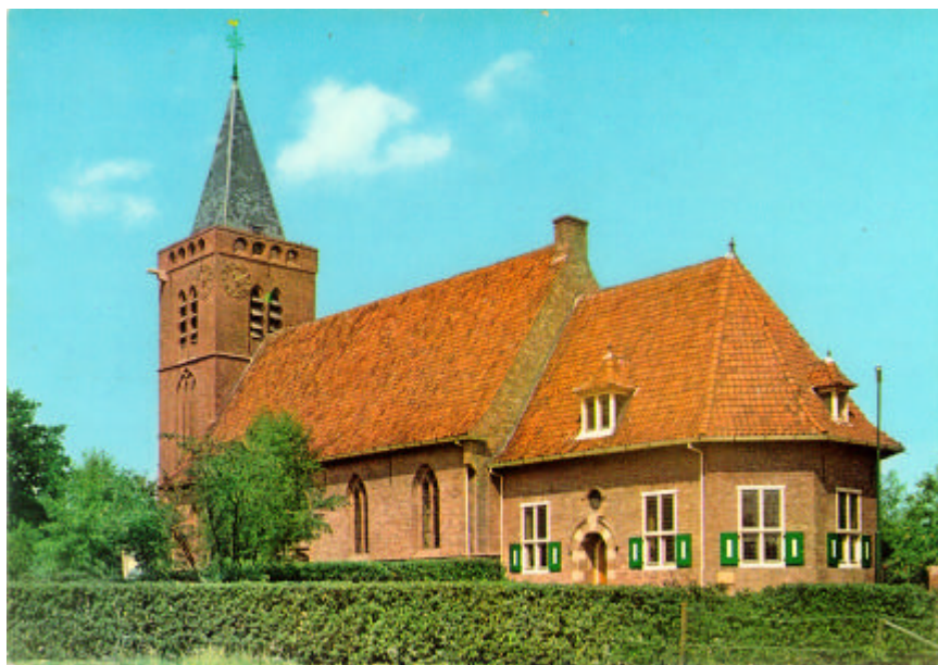
De kerk na de restauratie