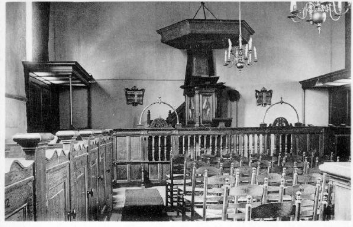
Interieur van de NH Kerk voor de verbouwing

grootere, rechthoekige ruimte, het schip, voor de geloovigen, en een kleinere vierkante, dan wel rechthoekige ruimte als choor, aan de voorzijde plat of half rond gesloten, in den lateren tijd veelhoekig. De ritus van den Roomsch-Katholieken Eeredienst en die van den Protestantschen voert tot een kernachtig verschil in plattegrond. In den ritus van den Roomsch-Katholieken Eeredienst is het het hoofdaltaar, dat als hoofdpunt zijn eigen ruimteomsluiting vraagt: het choor. In het eind der 16e eeuw toen ons land grootendeels Protestantsch was geworden, werden deze kerken en kerkjes door de Protestanten in bezit genomen en zoo goed en zoo kwaad als het ging ingericht voor hun zeer beperkten Eeredienst. Het hoofdaltaar werd verwijderd, het Priesterchoor zodoende een leege, ongebruikte ruimte. Als nieuw hoofdpunt trad de preekstoel op, veelal geplaatst in het midden der Noordzijde van het schip; daaromheen schaart zich de gemeente. De centraalbouw, meestal het grieksche kruis, is dan ook de plattegrond, welke bij de in de 17e eeuw door de Protestanten gebouwde kerken, o.a. de Noorderkerk te Amsterdam en de Nieuwe Kerk te 's-Gravenhage, werd gekozen als beter voldoende.