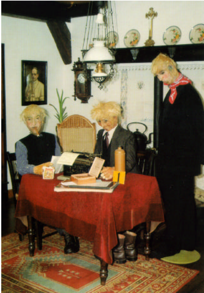
Het "kantoor" uit de begintijd van de Onderlinge Brandverzekering

Ook de Blaricumse stichting Couleur Locale wist de Kring te vinden: De CD van de Blaricumse Mattheus Passion werd in de Kring gepresenteerd.