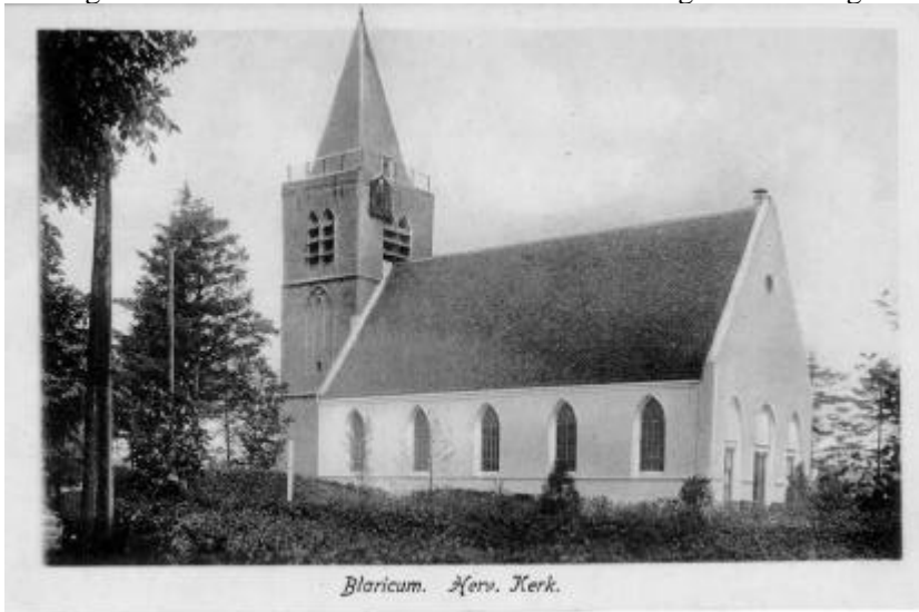
De NH-kerk voor de renovatie

Overigens niet voor het eerst. Bekend is dat in het begin van de negentiende eeuw het hele kerkgebouw in zeer slechte staat verkeerde.