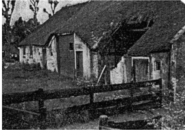
De boerderij (huisnr 10) aan de Middenweg voor verbou-