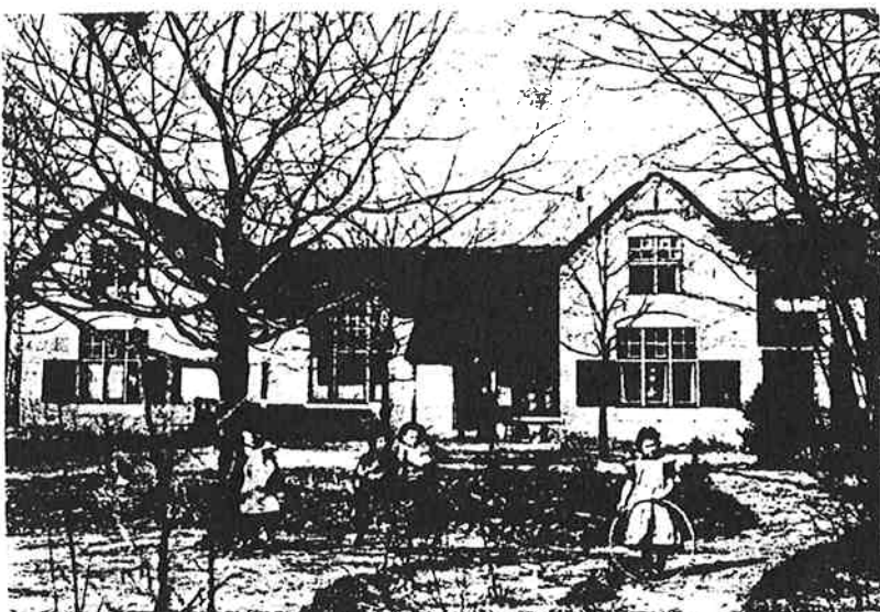
Koloniehuis van de Internationale Broederschap aan de Torenlaan te Blaricum rond 1904.