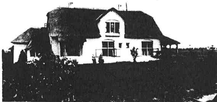
De Humanitaire School te Laren.