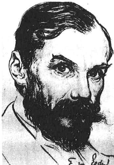
Frederik van Eeden

Na deze tijd in Amerika besloot Van Eeden zich geheel te wijden aan het schrijven, en een eind te maken aan zijn sociale experimenten. Wel interesseerde hij zich steeds meer voor het Rooms Katholieke geloof en treedt in 1924 tot deze kerk toe. Toch werd zijn levenskracht van zijn nooit-rustende-geest geleidelijk aan zwakker en op 16 juni 1932 is Van Eeden overleden. Hij is begraven op de R.K. begraafplaats te Bussum.