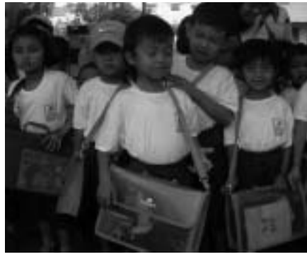
Weeskinderen met nieuwe spellen

deren in een ander opvangkamp te zijn verzorgd. Nu weer bij elkaar proberen zij een nieuw bestaan in Medan op te bouwen. Hoe het met hen gaat weet ik niet. Ik hoop dat de kinderen naar school zijn en dat zij een eigen plekje hebben om te wonen. Mijn hulpverlening was primair