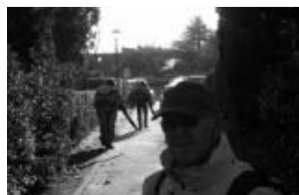
De bladblazers in actie

Er is eind vorig jaar weer hard gewerkt door onze medewerkers van de buitendienst om het vele blad van onze straten te krijgen. Dat is gelukt: snel en efficiënt. Zonder veel overlast. Het wegdek en de bermen zagen er keurig op tijd voor de feestdagen weer schoon en opgeruimd uit. Gemeente, bedankt!