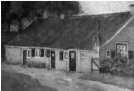
Het Armenhuis aan de Mosselweg

Vanaf de Meentweg, net voorbij de Langeweg, ligt een paadje, in de volksmond noemt men dit paadje 'het paadje tussen de Meentweg en de Mosselweg'. Oudere Blaricammers weten dat dit het begin van de Singel was. Deze weg stak de Mosselweg over, aan de linkerkant daarvan stond het Armenhuis. De Singel liep iets naar rechts om uit te komen waar hij nu begint: bij Bij de Berg. Het Armenhuis is gesloopt rond 1950, door Manus van der Heiden. Op deze plek zijn toen de huizen gebouwd die er nu staan. Van de gebikte steentjes van het gesloopte Armenhuis is toen de toegangspoort van de Algemene Begraafplaats gebouwd. Deze poort is helaas gesloopt voor de bouw van de huidige aula. Rond het Armenhuis lag veel grond waarop de mensen groente en aardappels verbouwden. Hiermee kon men in een levensbehoefte voorzien. Op de 'driest' voor het