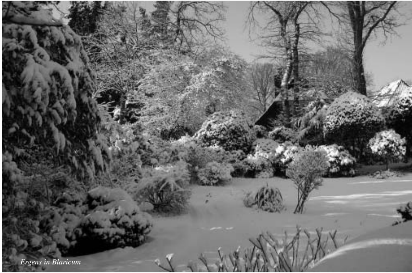
Ergens in Blaricum