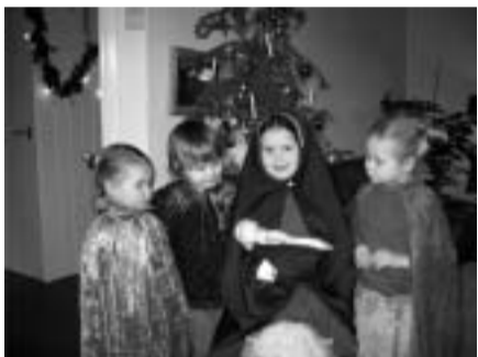
Het hobbelpaard doet dienst als ezel

En dan is het zover. We weten met wie we dit feest gaan vieren. De boom wordt zorgvuldig uitgezocht en opgetuigd. Het huis is versierd en ruikt zo lekker. We hebben bedacht wat we gaan eten en hebben zoveel mogelijk samen voorbereid. De kleden die we zullen dragen hangen klaar. Voor de één een zalige spanning, voor de ander, met boek bij de open haard, ontspanning. Bing Crosby zingt zijn carols. Het is kerst... ik wens jullie allen een heel goede!