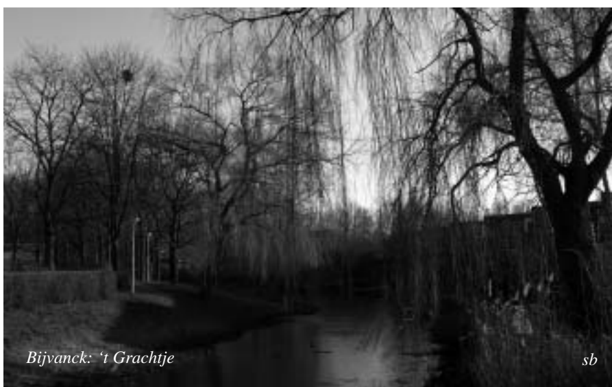
Bijvanck: 't Grachtje