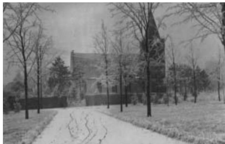
De Dorpskerk in 1929