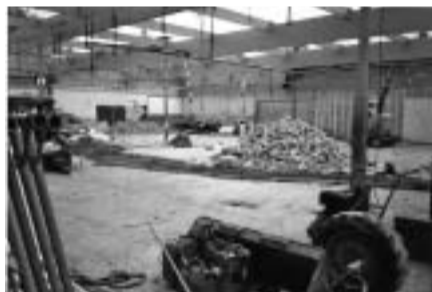
Tijdens de renovatie

Op vrijdag 6 oktober 2006 beleven we de laatste dag van het oude gebouw dat kreunt en steunt op zijn voegen. De laatste dag met om het uur steeds hogere kortingen op alle artikelen die zich nog in de winkel bevinden. Om 10.00 uur is er nog weinig te doen, maar om 15.00 uur zijn er al vele wachtenden die om 16.00 uur gebruik willen maken van 50% korting. Alle boodschappenwagentjes en alle mandjes zijn in gebruik. Jan Driessen deelt zelfs vuilniszakken uit om de gekochte levensmiddelen te vervoeren. De artikelen die na deze verkoopstunt nog over zijn, passen makkelijk in enkele kranten! Het is schitterend weer als op 9-10 oktober het oude lekkende dak wordt gesloopt en een nieuw dak wordt geplaatst. Kassa's worden afgevoerd, muren worden ontdaan van schappen en strippen. Diepvrieskasten zijn al eerder verdwenen. Op 11 oktober rijdt een kleine bulldozer over de vloer om alle vloertegels te strippen en op een hoop te vegen. Op 16 oktober wordt de nieuwe tegelvloer gelegd. Lange rijen tegels worden met de hand gelegd. Er komt geen machine aan te pas. Slechts een touwtje en een 'timmermans-oog' geven de 800 m 2 vloer een imposant uiterlijk. De nieuwe uitbreiding aan de achterkant van de winkel beslaat nog eens ca. 300 m 2 en geeft ruimte aan magazijn met daarboven kantine, machinekamer en