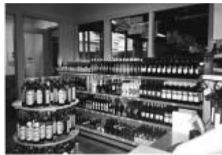
Na de renovatie

De bakkerij heeft verse broodjes die je per stuk zelf mag inpakken. Heerlijk vers gebak dat je eventueel ook een dag tevoren kunt bestellen. Vooraan in de winkel is een voordeelsstraat waar alle aanbiedingen bij elkaar staan en je nog goedkoper terecht kan. De slagerij is uitgebreid met